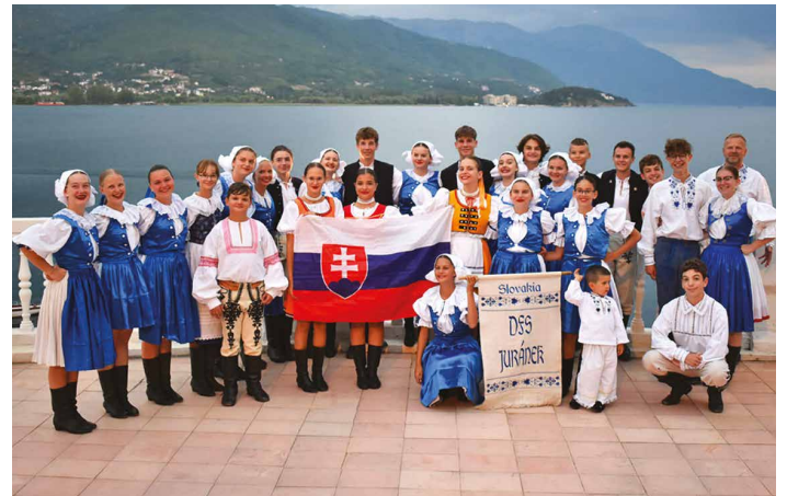
Reprezentácia DFS Juránek v Macedónsku

Začiatok roka bol síce neistý, ale rok 2022, ktorý bol bohatý na nové kamarátstva, festivaly, ale aj iné radostné podujatia, sme odštartovali s našou CM Juránečka práve fašiangovou zábavou v Holíči. A potom to už išlo ako z kopca. Krojová zábava, detské krojované slávnosti, letné kino, maškarák pre dospelých, detský maškarák, to sme ako organizátor zrealizovali u nás v Borskom Svätom Jure. Ako spoluorganizátor sme sa podieľali na stavaní mája, MDD a mnohých iných aktivitách. Potešili sme klientov DSS a absolvovali množstvo folklórnych festivalov doma aj v zahraničí. Za spomenutie stoja festivaly vo Veselí nad Moravou, Kunoviaciach, Krupine, Bratislave, Zlíne, v lete sme reprezentovali na medzinárodnom festivale v macedónskom Ohride. Spolu za rok sme sa zúčastnili viac ako 30 podujatí.