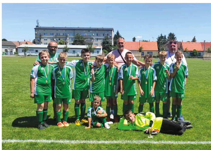
Mladší žiaci U13